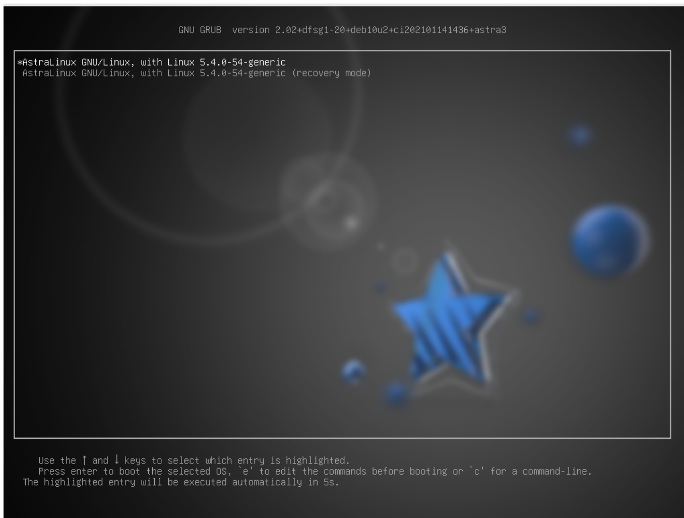
Рис. 1 – Окно запуска ОС

При запуске ОС появляется окно, вид которого представлен на рис. 1.